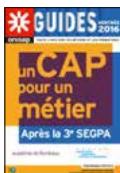
Un CAP pour un métier : après la 3 e SEGPA Rentrée 2016 Académie de Bordeaux 32 pages

Ce guide est disponible uniquement en téléchargement sur : http://www.onisep.fr/Mes-Infos-regionales/Aquitaine/Publications-de-la-region/Guides-d-orientation/Guide-Apres-la-2de-rentree-2016