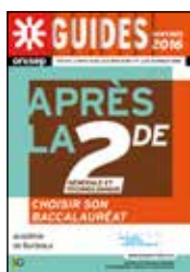
Après la 2 e générale et technologique Rentrée 2016 Académie de Bordeaux 32 pages

Ce guide est disponible uniquement en téléchargement sur : http://www.onisep.fr/Mes-Infos-regionales/Aquitaine/Publications-de-la-region/Guides-d-orientation/Guide-Apres-la-2de-rentree-2016