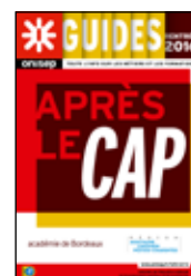
Après le CAP Rentrée 2016 Académie de Bordeaux 32 pages

Ce guide est en cours de diffusion dans les établissements scolaires et en téléchargement sur : http://www.onisep.fr/Mes-Infos-regionales/Aquitaine/Publications-de-la-region/Guides-d-orientation/Guide-Apres-la-3e-Segpa-rentree-2016